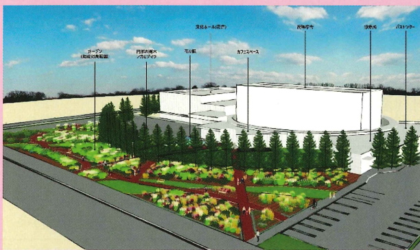
第34回 都市緑化機構賞 北海道東神楽町