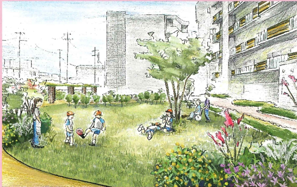
第34回 国土交通大臣賞 社会福祉法人玉美福祉会

地域のシンボリックな緑地として人と自然が共生する都市環境の形成、地域の活性化に寄与するプランを募集します。