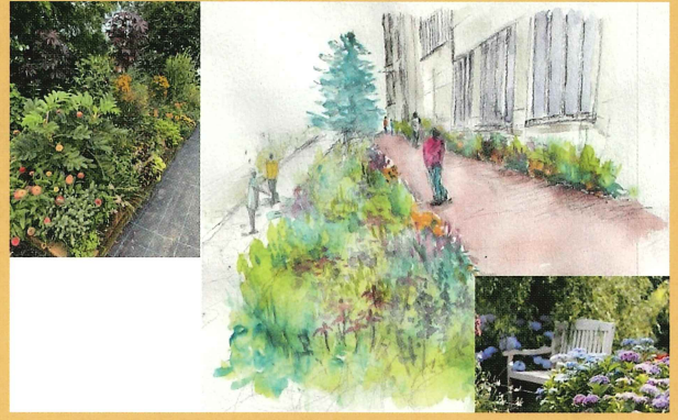
第34回 国土交通大臣賞 新潟医療福祉大学社会福祉学部社会福祉学科原口ゼミ

日常的花や緑の活動を通して、地域の活性化や子どもたちへの情操教育、身近な環境の改善に寄与するプランを募集します。