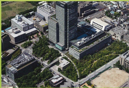
第43回 国土交通大臣賞