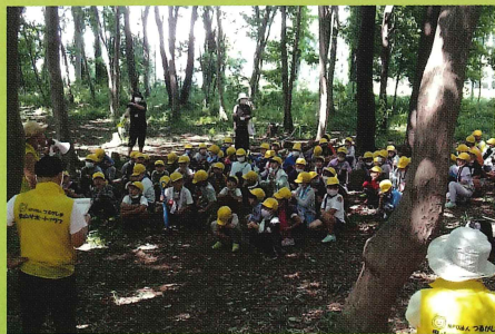
第43回 国土交通大臣賞

※ 活動助成金は、「緑の市民協働部門」の受賞団体のみを対象とさせていただきます。