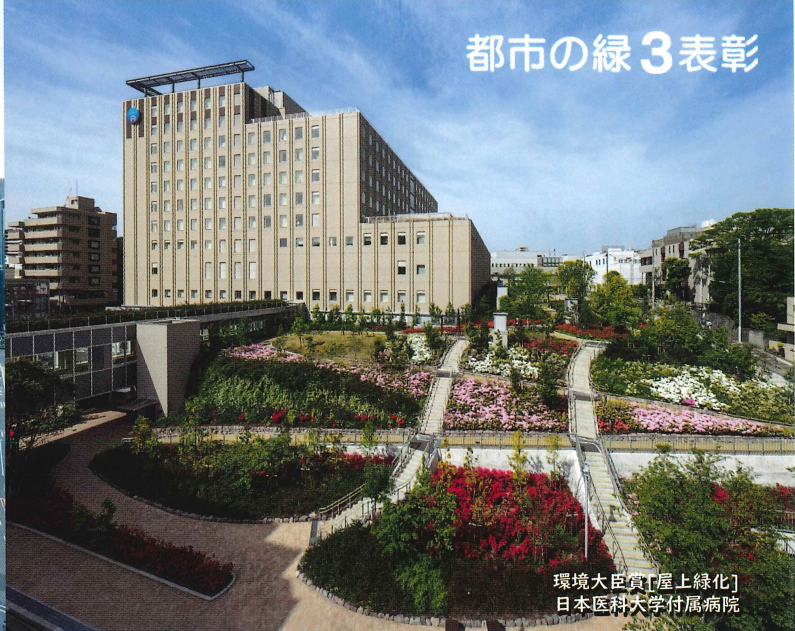
環境大臣賞[屋上緑化] 日本医科大学付属病院