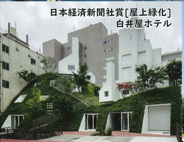
日本経済新聞社賞[屋上緑化] 白井屋ホテル