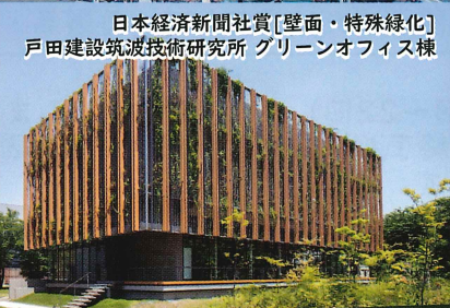
日本経済新聞社賞[壁面・特殊緑化] 戸田建設筑波技術研究所 グリーンオフィス棟