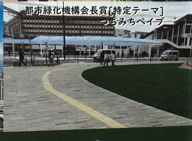
都市緑化機構会長賞[特定テーマ] つらみちペイブ