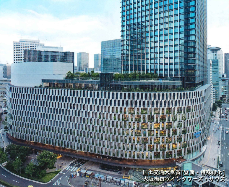
国土交通大臣賞[壁面・特殊緑化] 大阪梅田ツインタワーズ・サウス