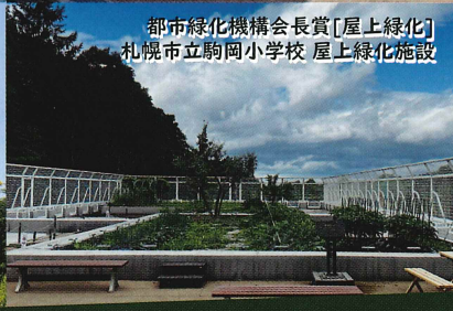
都市緑化機構会長賞[屋上緑化] 札幌市立駒岡小学校 屋上緑化施設