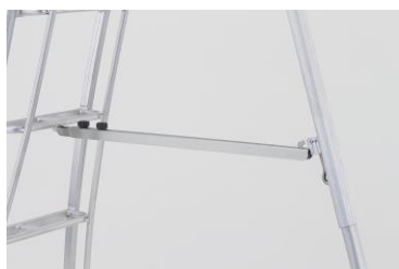
長谷川工業 「GSC-240T 閉じ止め金具」

すべての三脚に 75 度以下に保つ後付金具を取り付けて、使用しないと労働安全衛生規則（第 528 条）違反に問われる可能性があります。