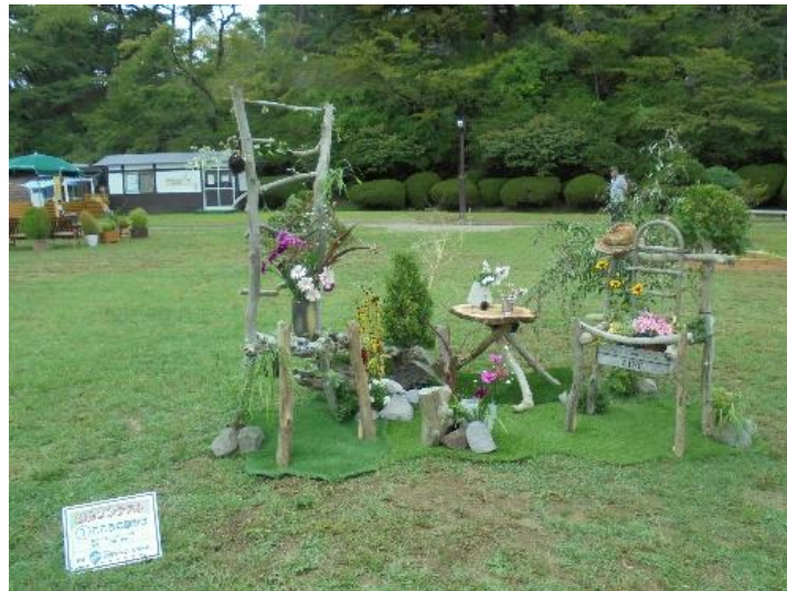
作品名 No. 1 こころの腰かけ 出展者 アルファグリーン(株) 戸嶋愛晴