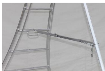
ハラックス 「用心棒」