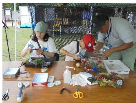
クリスマスリース作り体験