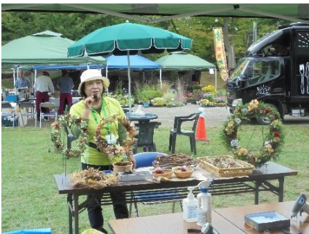
クリスマスリース作り体験